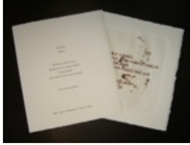
Taqbaylit – Kabylité